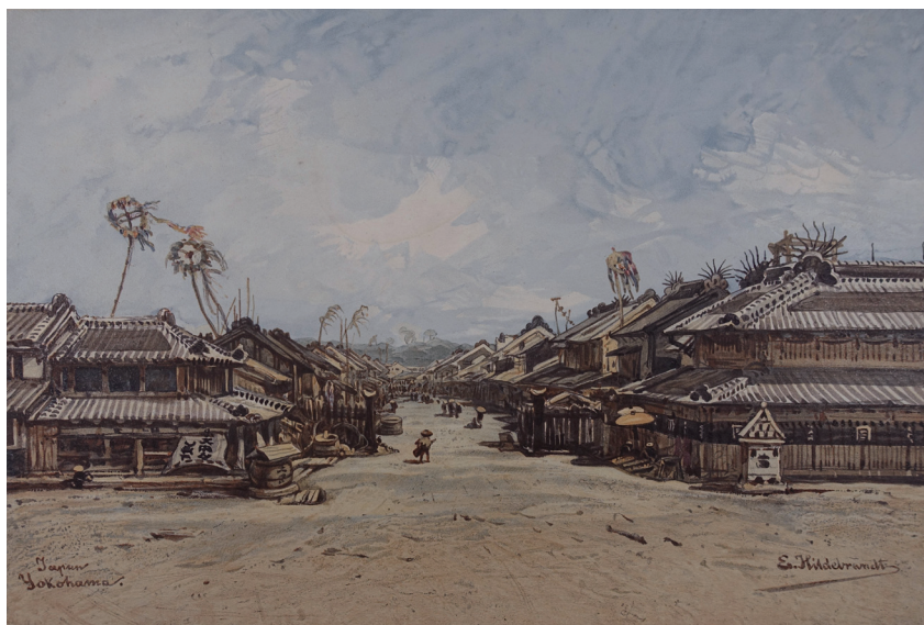
Abb. 3: Straße in Yokohama

Hildebrandts erster Spaziergang durch das sommerliche Yokohama, das ihn klimatisch an Neapel erinnerte, erwies sich als ein wahres Fest für die Augen. Er kam aus dem Staunen nicht heraus, „da immer nach vier bis fünf Schritten hundert neue Gegenstände mich fesselten und zwangen, mit offenem Munde stehenzubleiben.“