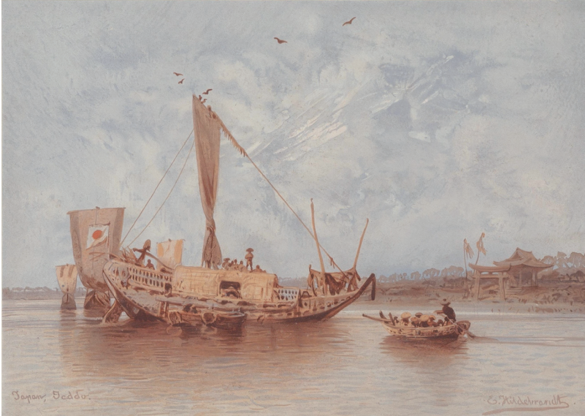
Abb. 4: Dschunke in der Bucht von Edo

Mein Herz pochte vor Aufregung, gesteht Hildebrandt, so war es mir denn wirklich gelungen, diese merkwürdige Stadt und in ihr den entferntesten Punkt meiner Reise im östlichen Asien zu erreichen!