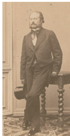
Eduard Hildebrandt, Düsseldorfum 1868