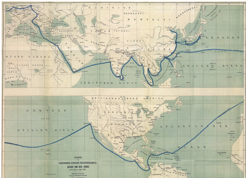
Abb. 6: „Karte zu Professor Eduard Hildebrand' Reise um die Erde in den Jahren 1862–1863“

Am 22. September nahm Hildebrandt Abschied von Japan, da er für die nächste Etappe seiner Weltreise unbedingt den Anschlussdampfer in Shanghai erreichen musste. Auf seiner späteren Reise, die ihn zunächst auf die Philippinen führte, dann über den Pazifik nach Mittel- und Nordamerika und schließlich über den Atlantik zurück nach Europa, erinnerte er sich gern an die abwechslungsreichen Wochen in Japan. Dort, bei dem „originellsten aller Völker“, durfte er eine teils angenehme, teils aufregende Zeit als einer der ersten deutschen Reisenden verbringen. Davon zeugen nicht zuletzt seine Reiseerinnerungen wie seine künstlerische Hinterlassenschaft an Aquarellen und Skizzen, die heute zum großen Teil in Berliner Museen aufbewahrt werden oder sich in Privathand befinden. 14